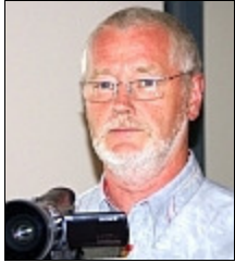
Siegfried Röscke Foto / Video / Medien

Telefon: 0176 66 831 465 Hikmet.Guevenc@gmx.de