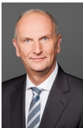
Dr. Dietmar Woidke Ministerpräsident des Landes Brandenburg